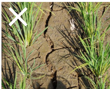
大ヒビ (乾かしすぎ)