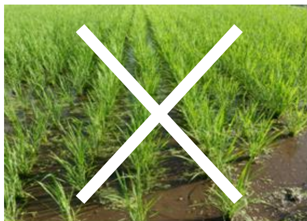
中干し開始時期としては遅い